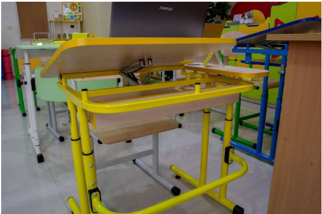
Стіл з автоматичним регулюванням нахилу стільниці