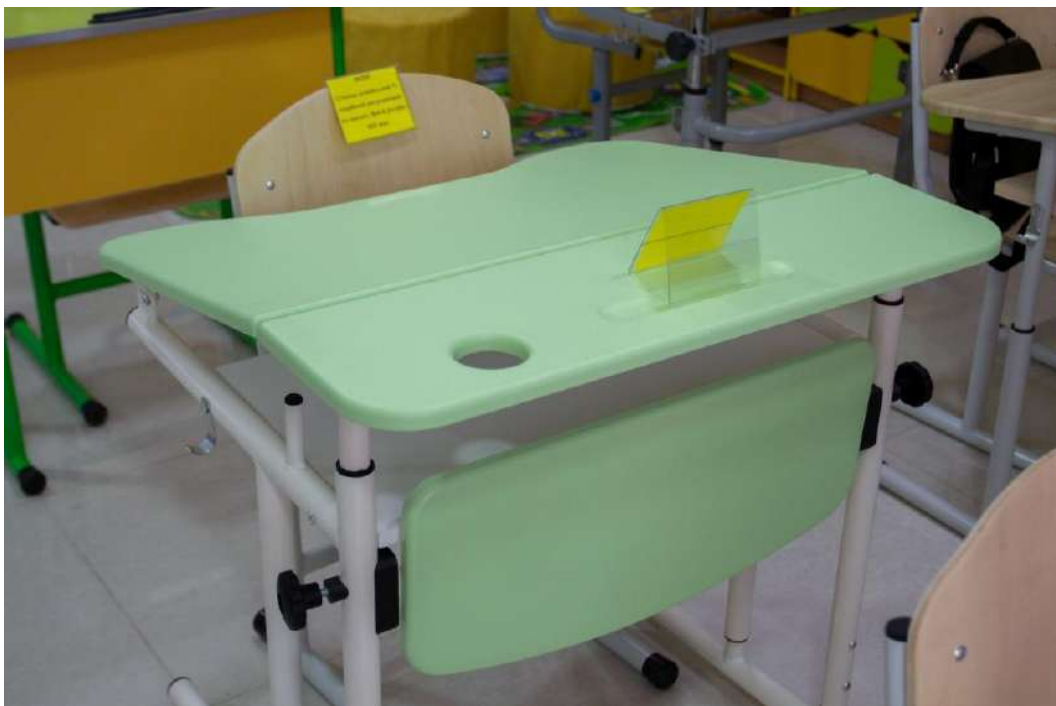
Столи з мобільним регулюванням висоти стола