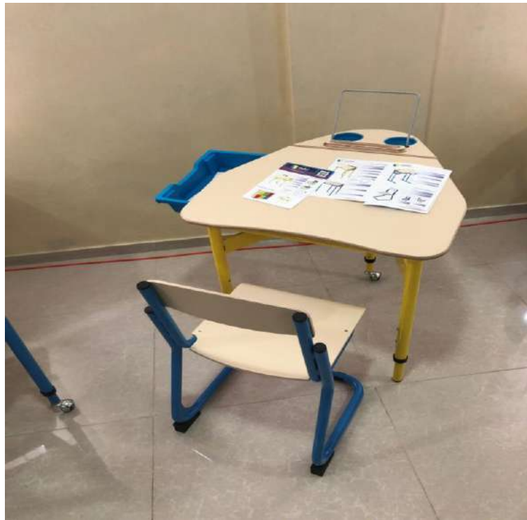
Стіл із висувними шухлядами для приладдя зліва і справа