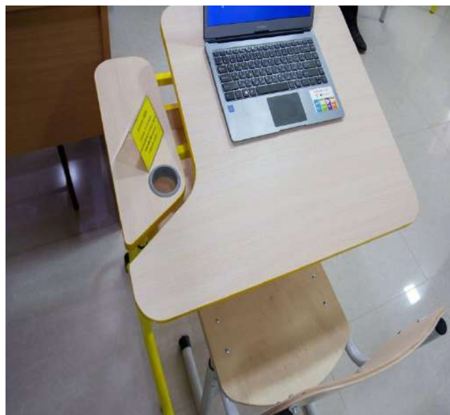
Столи з автоматичним регулюванням нахилу стільниці