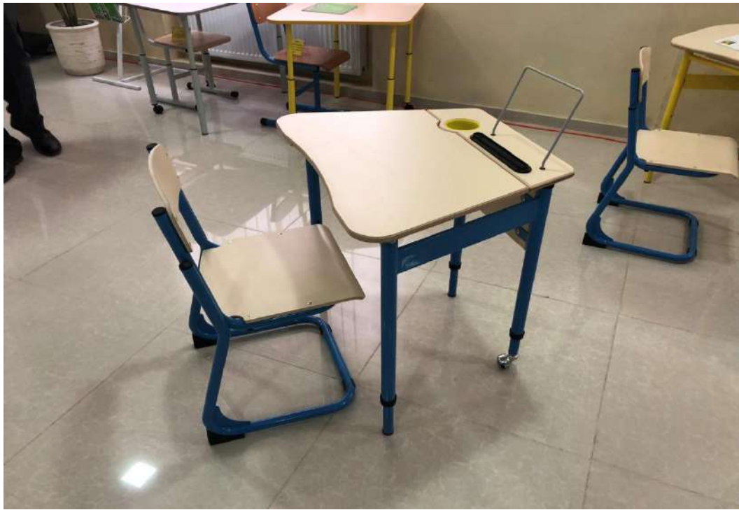
Столи з допоміжним коліщатком для мобільного пересування