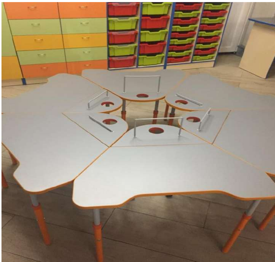
Одномісні регульовані/нерегульовані столи з різною формою стільниці, які можна легко перемістити або скласти разом для групової роботи