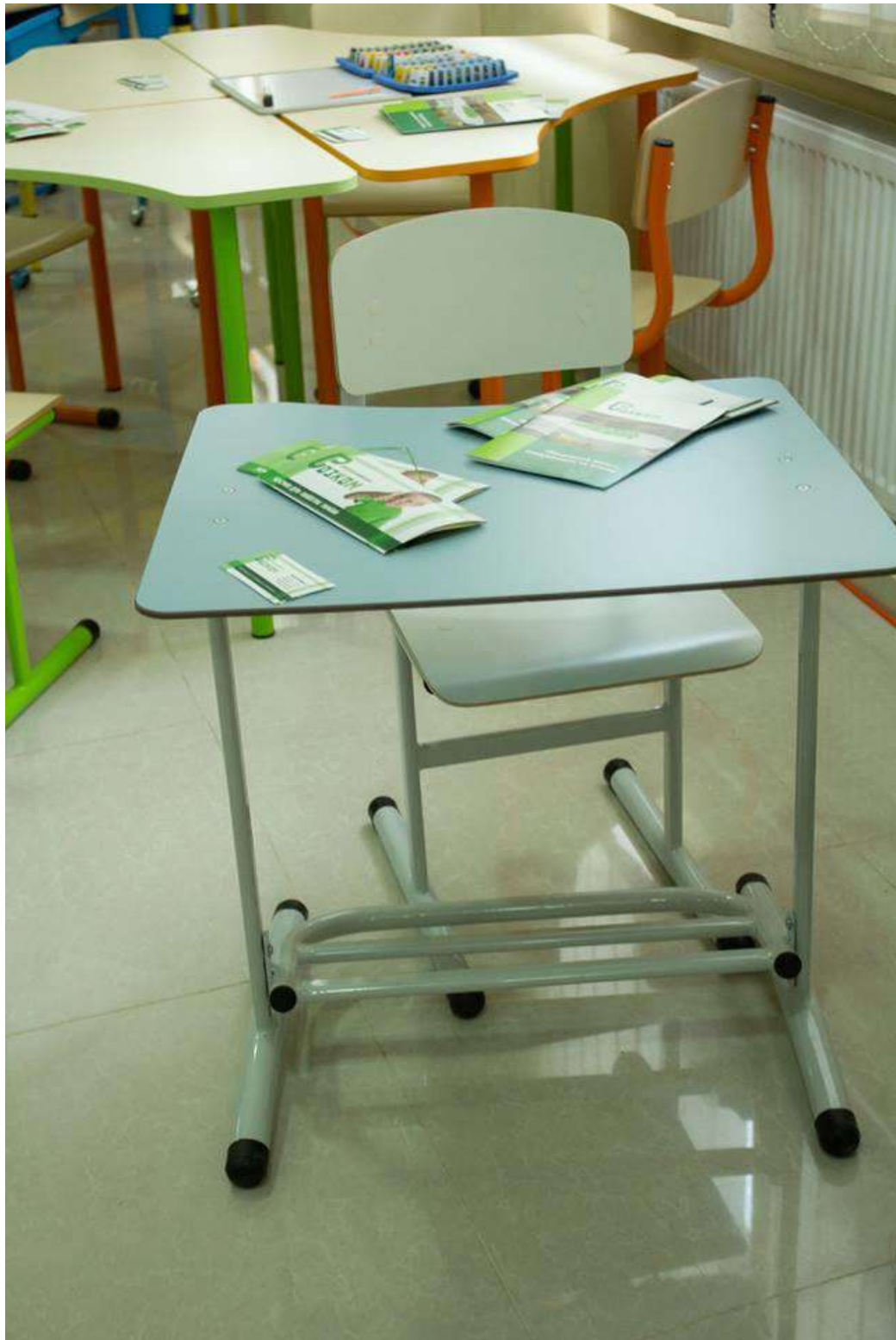
Стіл із додатковим фіксуванням стійкості та підставкою для ніг