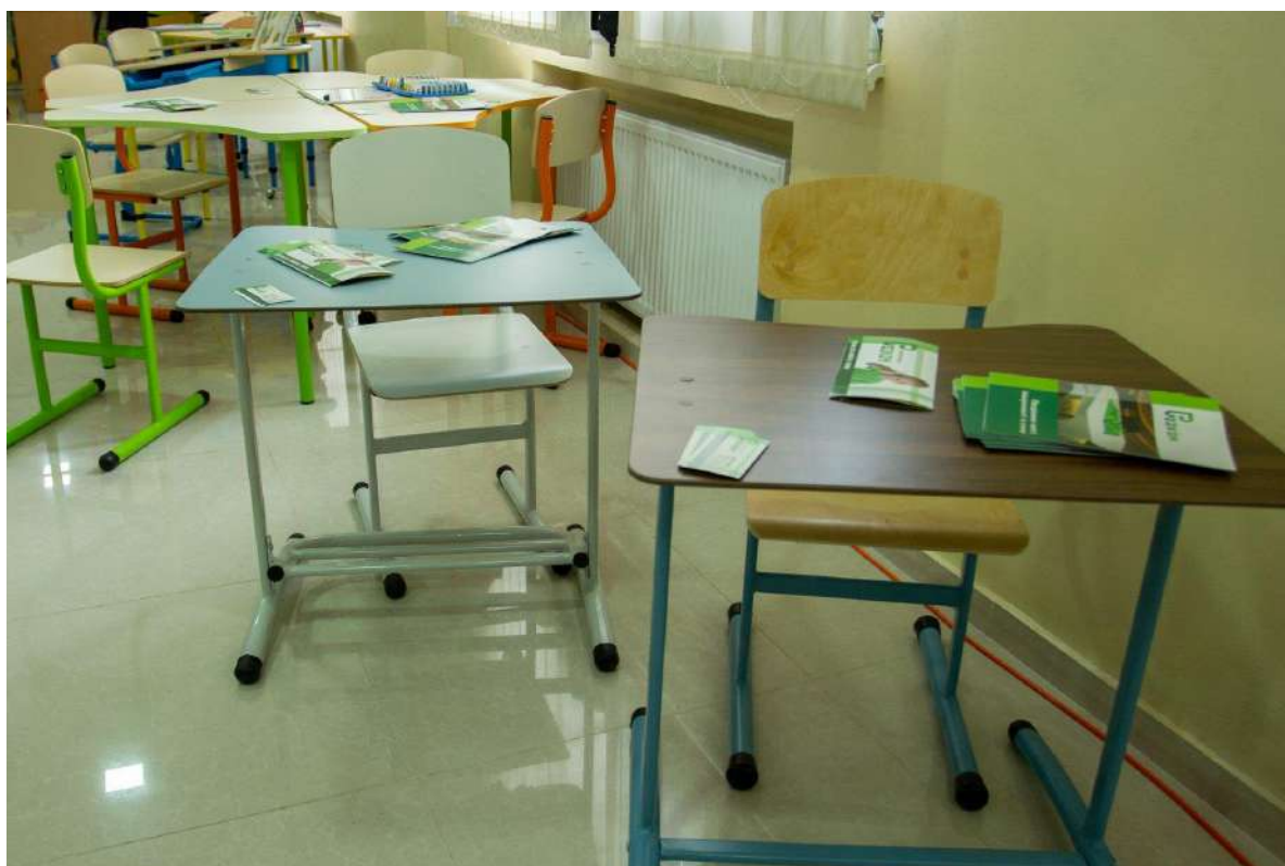
Стіл із додатковим фіксуванням стійкості та підставкою для ніг